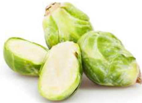
las coles de bruselas